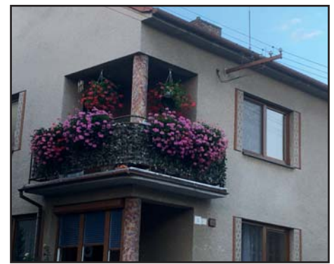
Petra Bělohoubková, Strážnická 13 - balkon